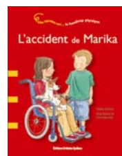
Une histoire sur... le handicap physique