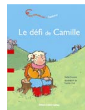
Une histoire sur... l'asthme