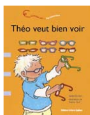
Une histoire sur... les lunettes