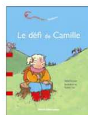
Une histoire sur... l'asthme