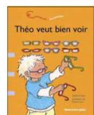
Une histoire sur... les lunettes