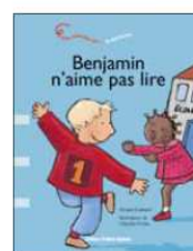
Une histoire sur... la dyslexie