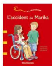
Une histoire sur... le handicap physique