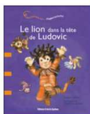
Une histoire sur... l'hyperactivité